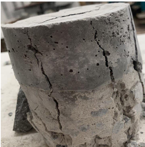
Рис. 11. Характер руйнування зразка підготовленого до випробувань за допомогою ремонтної суміші Mapegrout Thixotropic

Рисунок 11 демонструє характер руйнування зразків підготовлених до випробувань за допомогою ремонтної суміші Mapegrout Thixotropic.