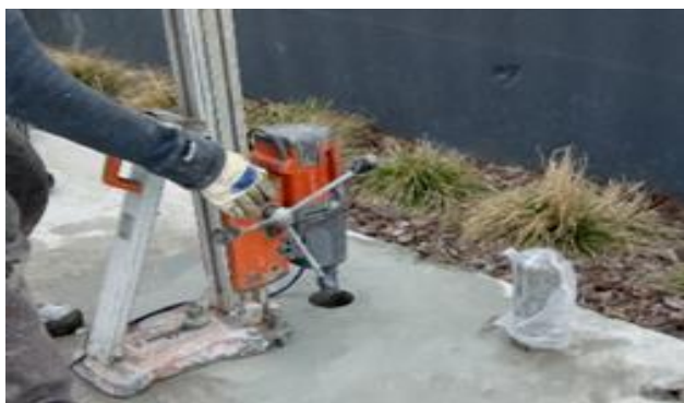
Рис. 3. Відбір кернів

Для вивчення властивостей бетону пошкодженої ділянки відібрали зразки кернів (рис. 3 та 4).