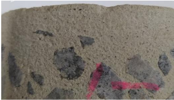
Рис. 5. Верхня зона керна