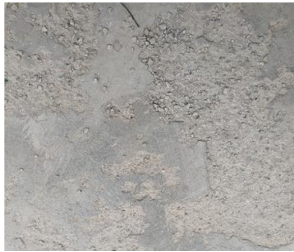
Рис. 2. Пошкодження бетонної поверхні досліджуваної ділянки

Виклад матеріалу. Дослідження проведене в умовах реального об'єкта. Під час експлуатації (9 місяців із моменту укладення бетонної суміші) виявлено ділянки бетонної поверхні з дефектами (рис. 1). Пошкодження мають локальний характер та характеризуються злущенням верхнього шару поверхні (рис. 2).