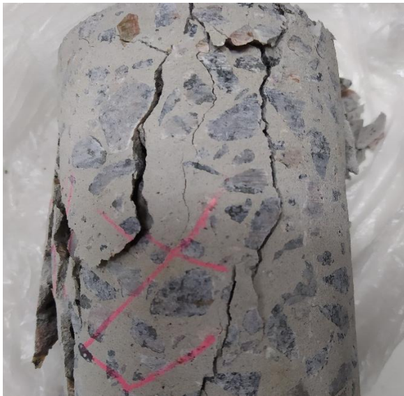
Рис. 10. Характер руйнування зразка підготовленого до випробувань за стандартною методикою

Рисунок 11 демонструє характер руйнування зразків підготовлених до випробувань за допомогою ремонтної суміші Mapegrout Thixotropic.