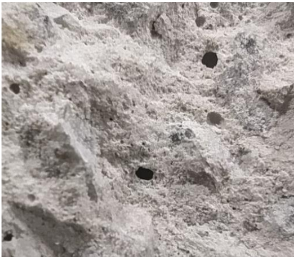
Рис. 7. Порова структура бетону зразка

Із відібраних кернів підготовлено зразки відповідно до вимог [5]. Для більшості зразків цих вимог дотримано. Однак три зразки випробувати за нормами не вдалося. Для двох зразків неможливо було забезпечити нормативний інтервал співвідношення висоти зразка до його діаметра. Зменшення діаметра керна