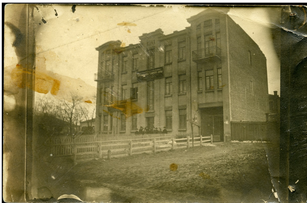
Рис. 1. Катеринославські Технічні Курси (Technikum) В. Х. Коробочкіна. У Катеринославі на рогу вул. Скакової (тепер вул. Антоновича, 49) та Гімнастичної (нині – Шмідта.) Січень, 1913 рік

В Приватному Архіві Автора [ПАА] збереглася світлина тільки на початку своє існування нової триповерхової будівлі Катеринославських Технічних Курсів В. Х. Коробочкіна (рис. 1). Підтвердження тому – ще не прибрана огорожа будівельного майданчику.