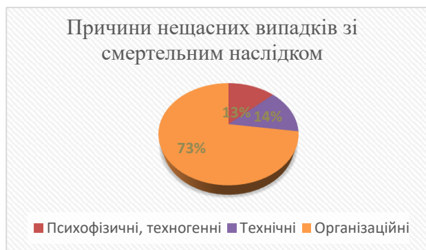
Рис. 1. Причини нещасних випадків зі смертельним наслідком на виробництві

Виходячи зі статистики [1], будівництво – це одна з найнебезпечніших галузей, що визначено підсумком за 2021 рік (рис. 1).