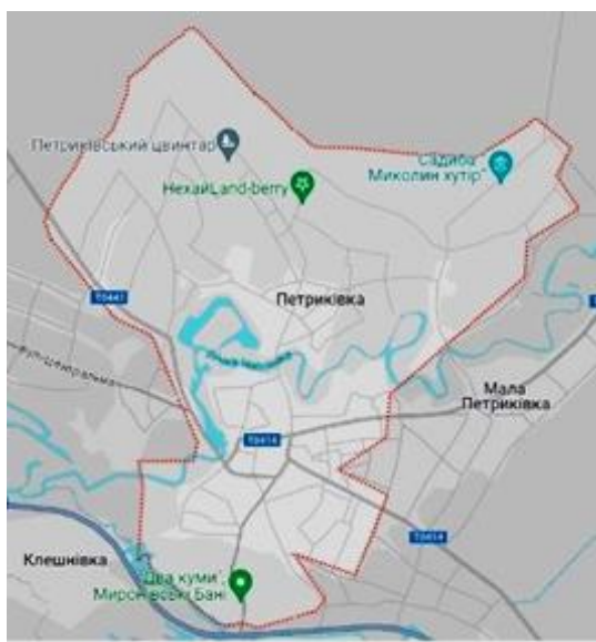
Рис. 1. Ситуаційна схема

Петро Калнишевський, останній кошовий війська запорізького, та його ініціатива щодо перетворення Петриківки на центр Протовчанської військової паланки, значно вплинули на розвиток цього мистецтва.