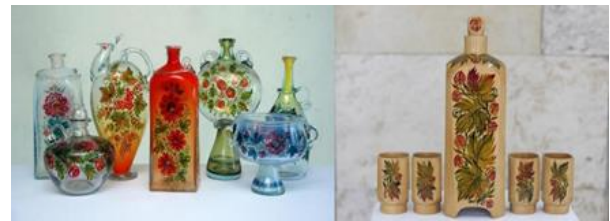
Рис. 14. Роботи майстра, виконані на склі та по дереву

Майстри представляють Петриківський розпис на регіональних, всеукраїнських та міжнародних виставках. Для залучення відвідувачів та популяризації народного мистецтва в Центрі постійно діє свій виставковий зал із різними експозиціями. Адміністрація закладу проводить активну виставкову діяльність в Україні та за її межами.