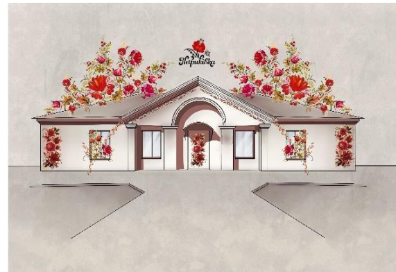
Рис. 2. Петриківка

XIX столітті завдяки зусиллям відомого вченого Д. І. Яворницького, що говорить про значущість цієї культурної традиції.