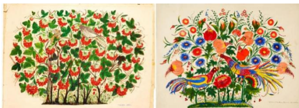
Рис. 6. «Зозуля на калині» (1960)

Творчий метод Петриківського розпису оснований на народному баченні світу, який забезпечував вільне виявлення творчої особистості народного майстра. Тетяна Якимівна Пата – талановита художниця, народилася в селі Петриківка на Катеринославщині 4 березня 1884 року. Її тонкий художній смак і живописна майстерність вражають. Вона віртуозно творила загадкові райські кущі з простих польових і садових квітів. (рис. 6–7).