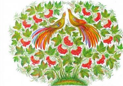
Рис. 12. «Півник»