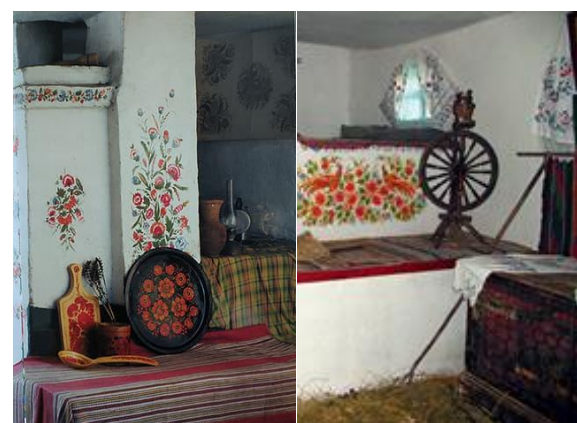
Рис. 3. Петриківський розпис. Інтер'єр хати.

На цей період зменшилася кількість хат, розмальованих власноруч самими господарями (рис. 3).