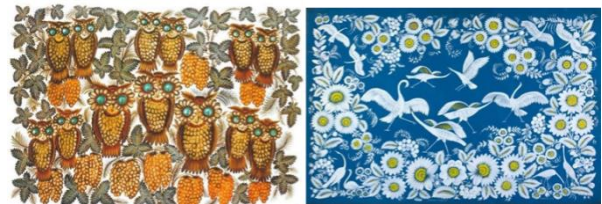
Рис. 9. «Сови» (1977)