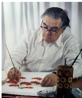
Рис. 8. Федір Савич Панко (1924–2007)

Працювала викладачем в Петриківській школі декоративного розпису у 1936–1941 роках. Під творчим та чуйним керівництвом Т. Пати з цієї школи вийшло