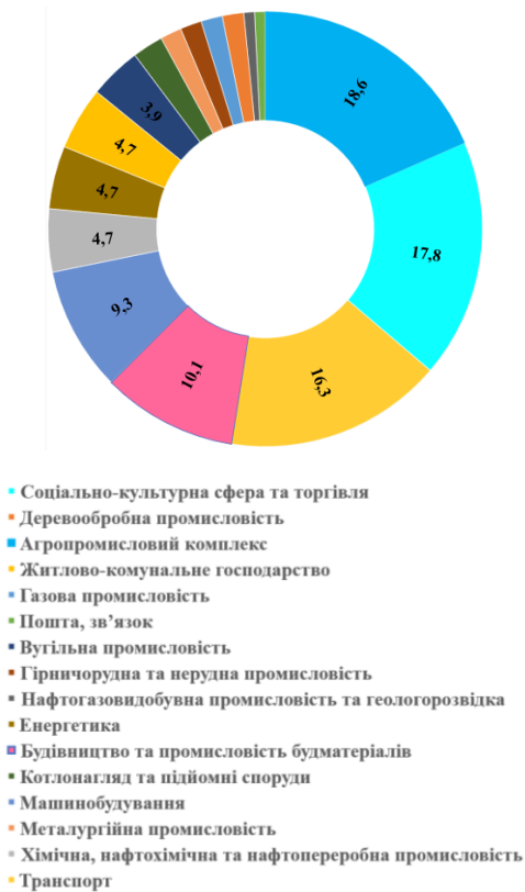
Рис. 1. Питома вага нещасних випадків на виробництві зі смертельним наслідком за видами діяльності України станом на травень 2024 року