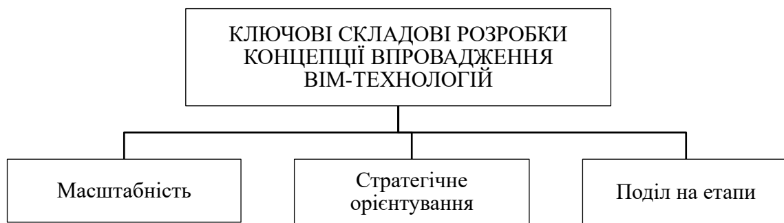
Рис. 2. Основоположні складові розробки ефективної концепції впровадження BIM-технологій в управлінні девелоперськими проектами.

На рисунку 2 відображено основоположні постулати розробки ефективної концепції впровадження BIM-технологій в управлінні девелоперськими проектами