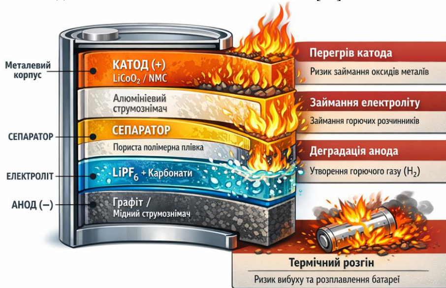
Рис. 1. Склад літій-іонного елемента

Проаналізуємо окремі конструктивні елементи, щодо ризику пожежної небезпеки. На рисунку 1 детально наведено характеристику і склад літій-іонного елемента [26].