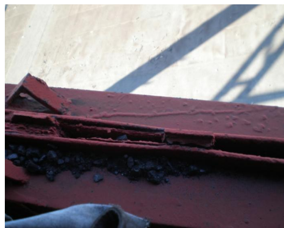
Рис. 3. Міжцілинна корозія виникла між парними кутиками розпірки вежі, що призвело до руйнування зварних швів