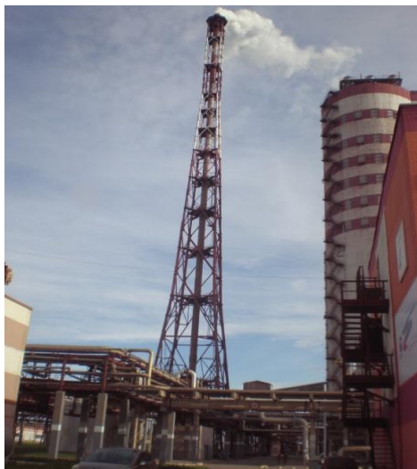
Рис. 1. Загальний вигляд веж висотою 180 м цеху азотної кислоти

Постанова проблеми. Металеві конструкції несучих веж, які забезпечують функціонування димових і вентиляційних труб промислових підприємств, є ключовими компонентами інженерної інфраструктури (рис. 1).