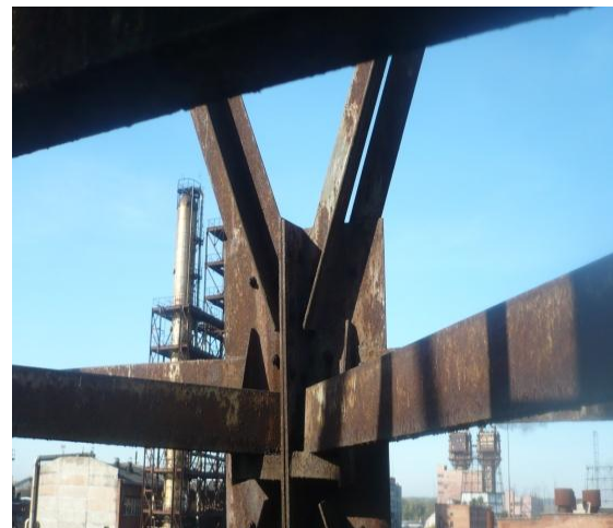
Рис. 2. Пошкодження захисного лакофарбового покриття, що перевищує 30 % загальної площі поверхні вежі

– локальні деформації (згини) елементів решіткової конструкції вежі (дефект 4);