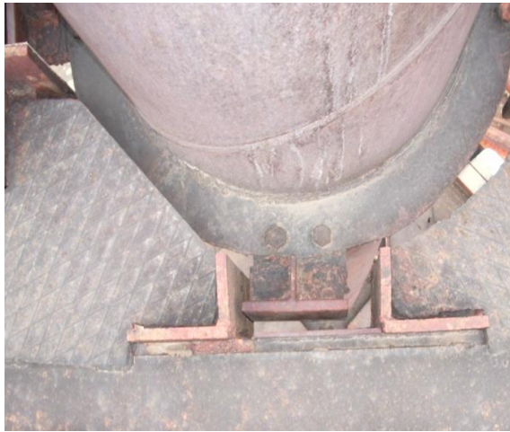
Рис. 4. Понаднормовий проміжок між елементом діафрагми вежі і ковзним упором труби